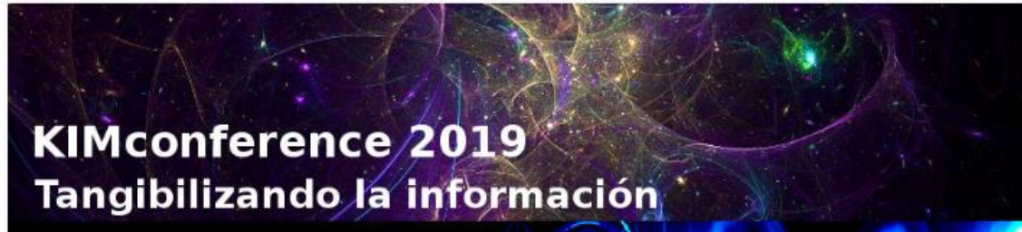
Imatge 6. 39 y más. https://www.39ymas.com/kimconference-2019-del-homo-sapiens-al-homo-deus/