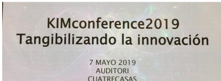
Imatge 7. VCA consultoria d'innovació - https://www.vc-alternative.com/blog/2019/05/07/kimconference-2019-key-takeouts/