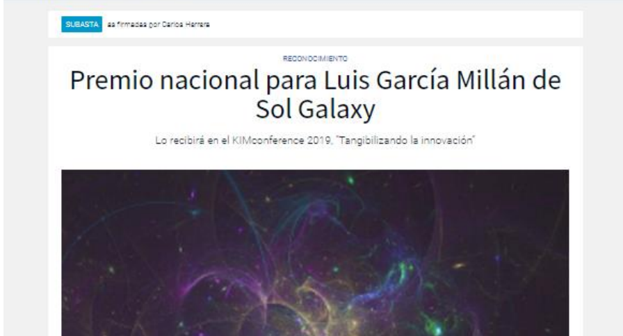
Imatge 4