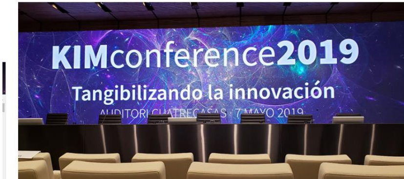
Imatge 3. Basetis Blog - https://blog.basetis.com/es/content/mi-paso-por-la-kimconference-2019

Publicado por Rubén Fernández el 13-05-2019